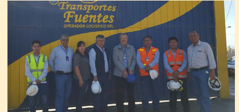
Auditoría de Certificación a empresa Transportes Fuentes Operadores Logísticos S.R.L.

BASC PERÚ realizó 149 auditorías en los meses de julio y agosto: 103 Aud. de Recertificación, 21 Aud. de Certificación, 12 Aud. de Control, 01 Aud. Complementaria y 12 Registros iniciales, con el fin de verificar la implementación y el mantenimiento del Sistema de Gestión en Control y Seguridad (SGCS) BASC con respecto a la Norma y el Estándar correspondiente.