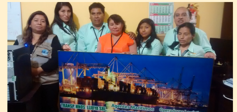
Auditoría de Certificación a empresa Transportes Lluya S.R.L. - Chincha

Además, para el mes de setiembre se tiene previsto realizar 29 auditorías entre las ciudades de Piura, La Libertad, Arequipa, Ica, Lambayeque, Ancash, Moquegua; a los sectores: Exportador, Agente de Carga/ Agente Marítimo, Serv. de Vigilancia y Seguridad Privada, Empresas de Serv. Temporal/ Suministro de Personal o Equipos y Transportador de Carretera.